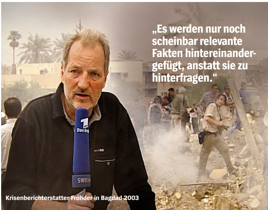
Krisenberichterstatte Fröhder in Bagdad 2003

an der Sendung reagiert. Er gibt dort manchmal Fehler zu, manchmal wirbt er um Verständnis für die Arbeitsabläufe. Manchmal prügelt der von Kritikern Angegriffene auch bloß genervt zurück. „Auf die Gefahr hin, dass ich jetzt wieder richtig auf die Fresse bekomme: Mir langt’s“, schrieb er zum Vorwurf, die Inszenierung der Regierungschefs als Teil der Pariser Demo nicht transparent gemacht zu haben. Das sei „kompletter Unfug“, wettete Gniffke. Schließlich handle es sich „immer“ um Inszenierung, wenn Politiker vor Kameras träten.